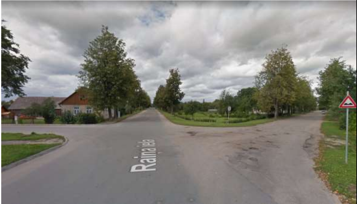
Raiņa un Pilsoņu ielas krustojums Balvos pirms rekonstrukcijas (2011. gads) 6

(uzsākts 2012. gadā, pabeigts 2013. gadā, īstenots 14 mēnešos)