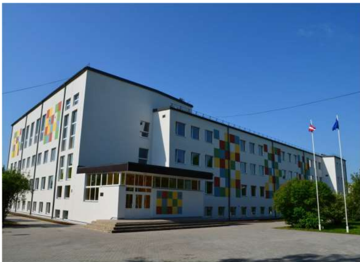
Balvu Valsts ģimnāzijas pēc projekta īstenošanas, 2014.gads 4

(uzsākts 2013. gadā, pabeigts 2014. gadā, īstenots 18 mēnešos)